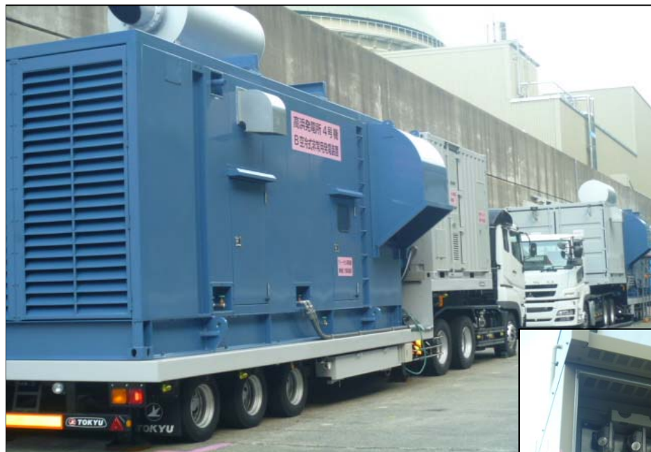
空冷式非常用発電装置