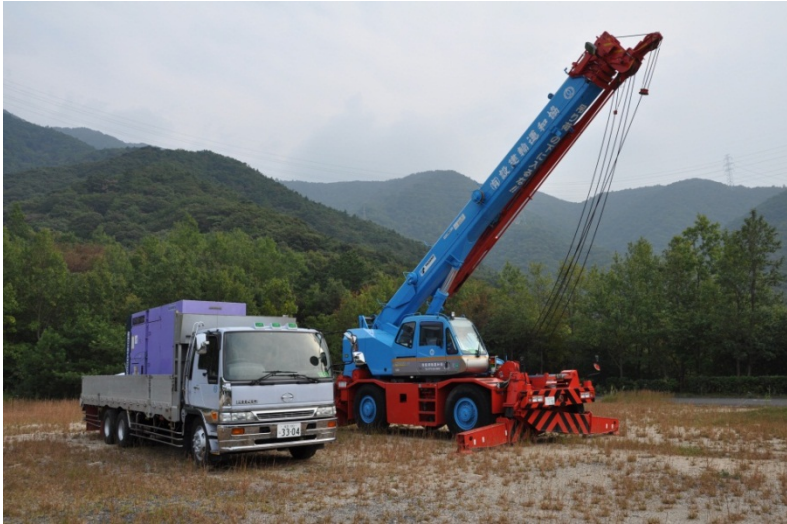
ポンプ用電源と運搬用クレーン車及びトラック