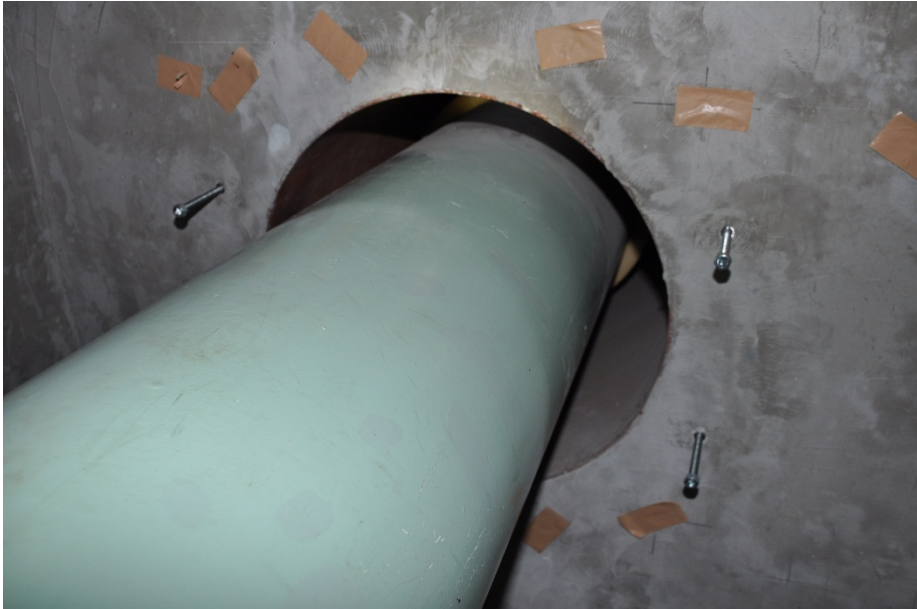
海水配管貫通部(施工前)