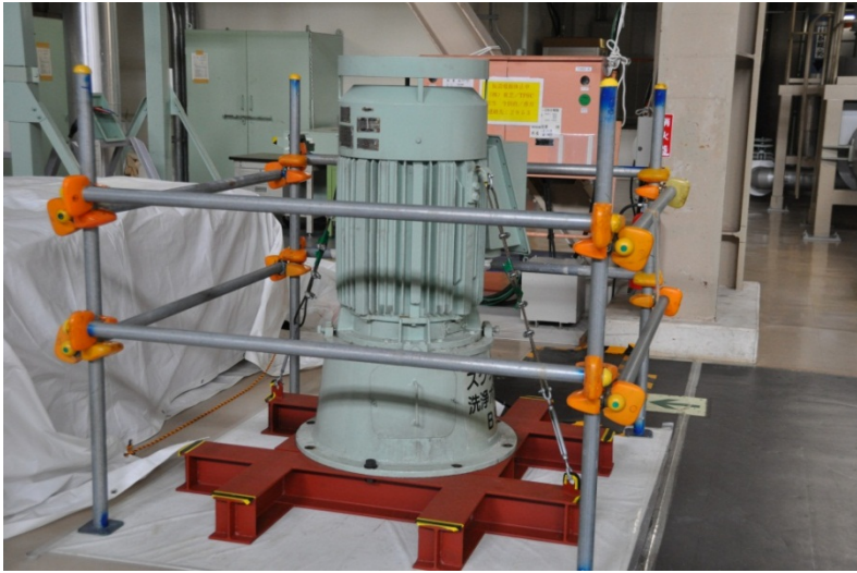
ポンプ駆動用電動機