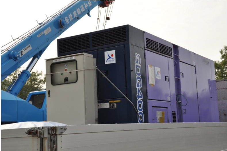
ポンプ用電源(拡大)