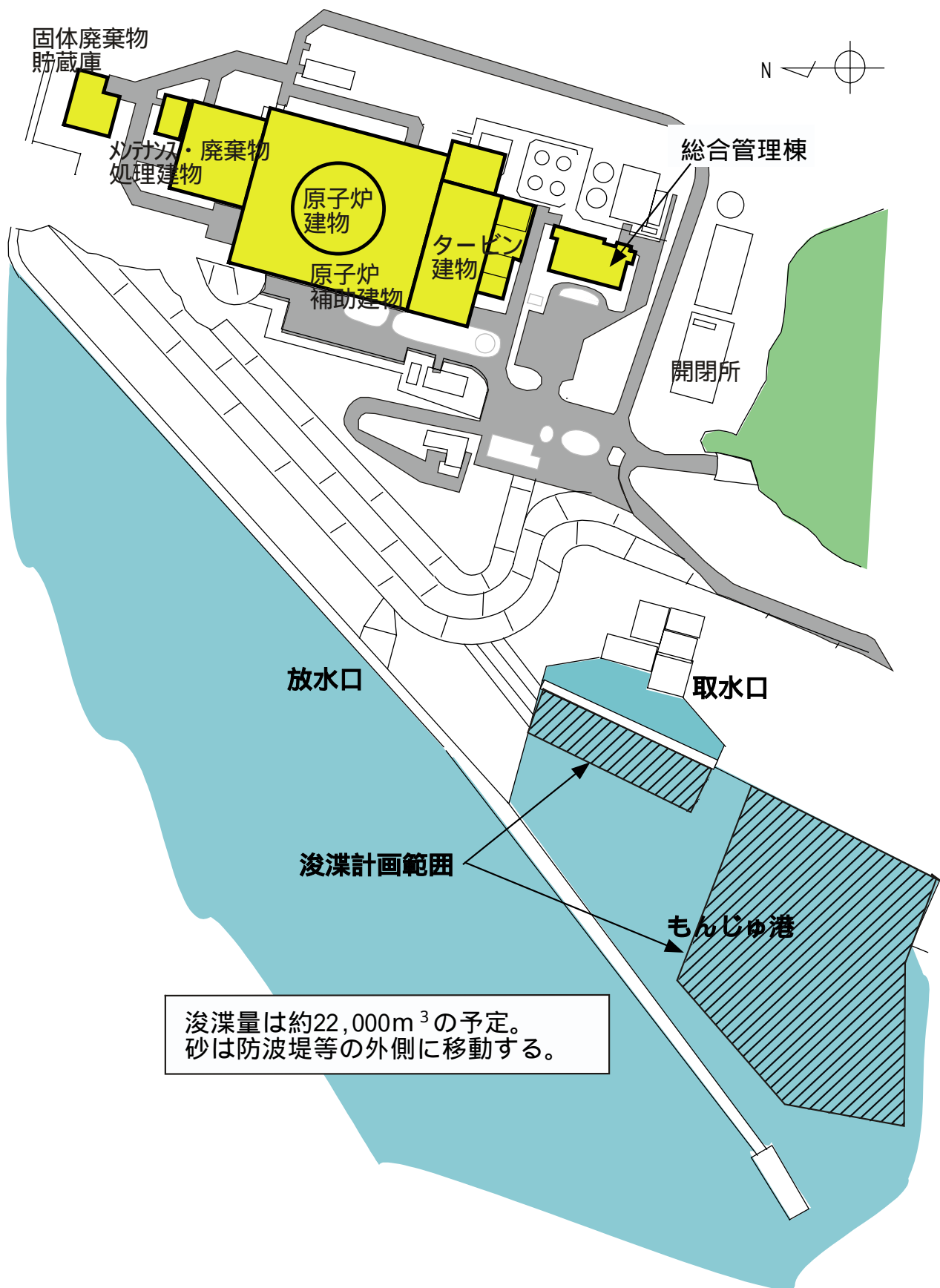
図 - 2 もんじゅ港湾の浚渫