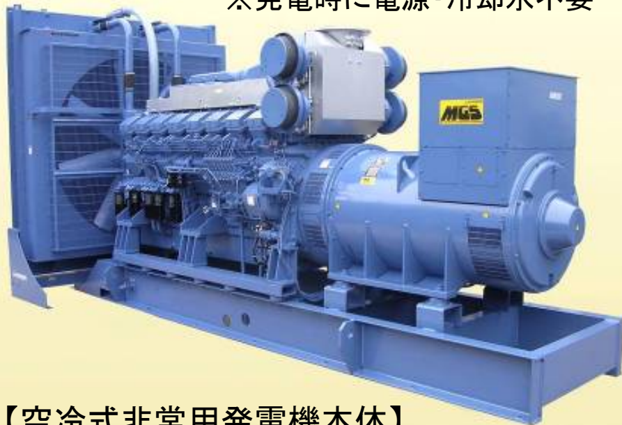
【空冷式非常用発電機本体】