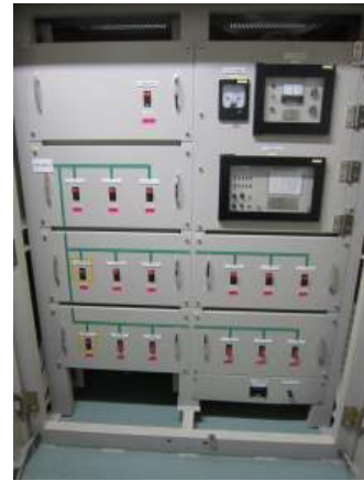
写真3-2 直流きでん盤 (負荷切り離しのしゃ断器)