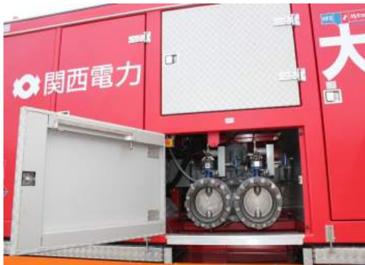
写真 2-1 大容量ポンプ接続口