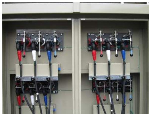
写真1-2 空冷式非常用発電装置接続盤