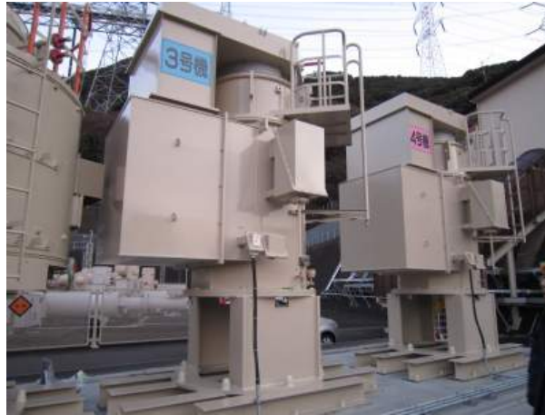
写真6 海水ポンプ予備モーター