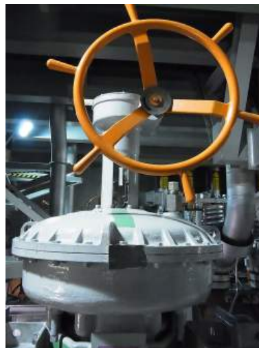
写真 5-2 主蒸気逃がし弁手動ハンドル