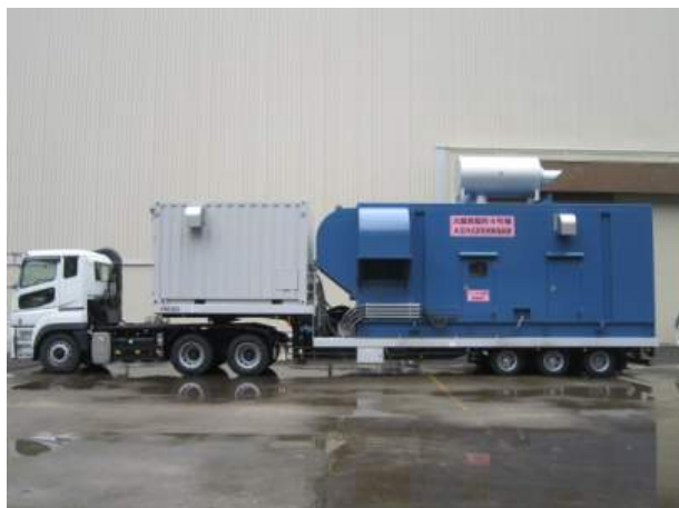
写真1-1 4号機空冷式非常用発電装置(A)