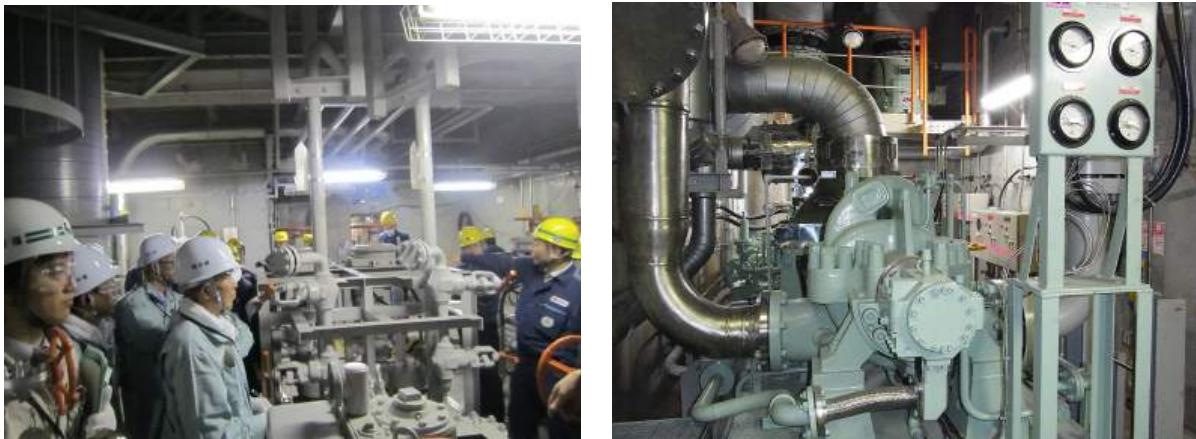
写真4 タービン動補助給水ポンプ外観