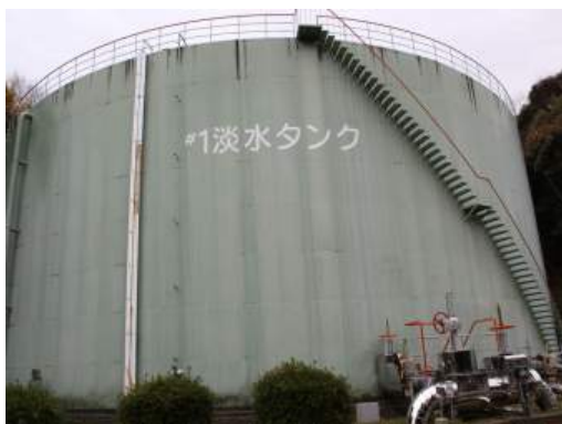
写真 1 1 - 1 淡水タンク