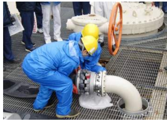
写真 2-2 海水ポンプ接続口 (海水ストレーナ出口)