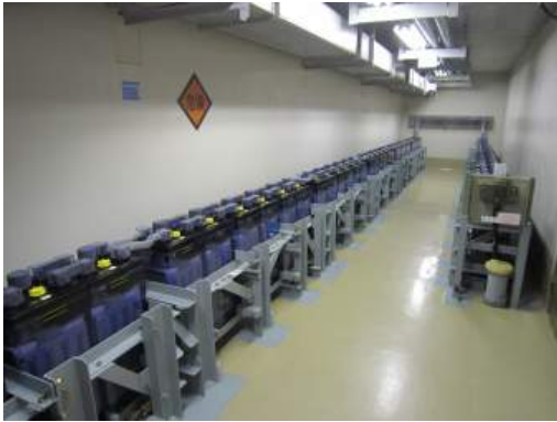
写真3-1 バッテリー室