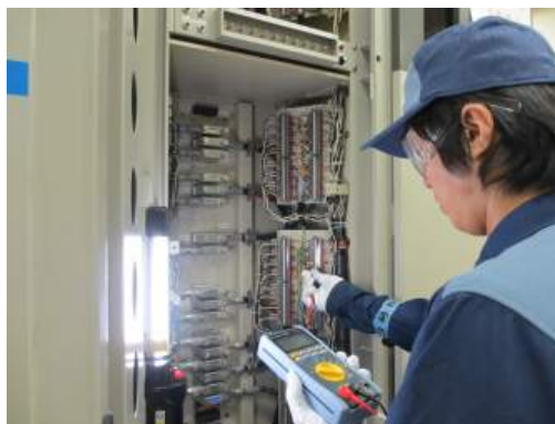
写真8 可搬型計測器の使用状況