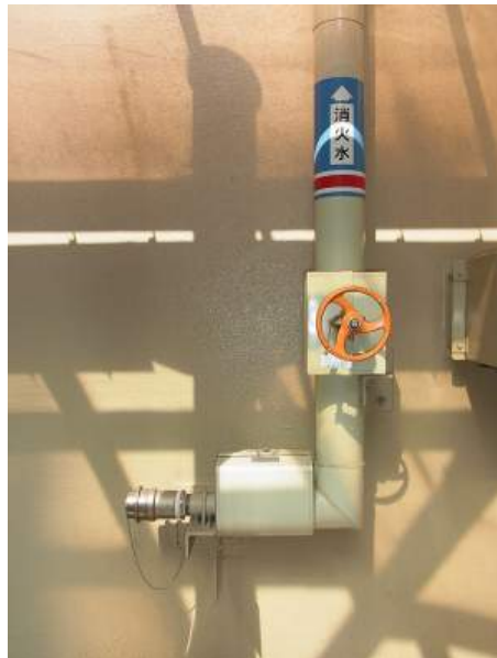
写真 2-3 消火水系統の消火水接続口（制御建屋 4 号機側）