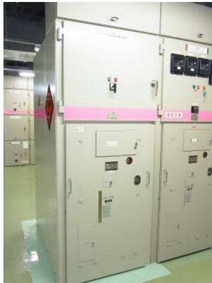
写真 1-3 高電圧開閉装置（空冷式非常用発電装置用のしゃ断器盤）