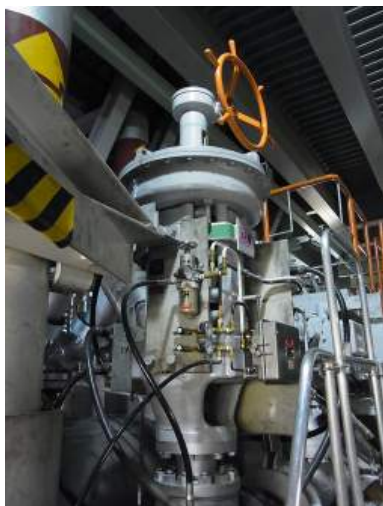
写真 5-1 主蒸気逃がし弁外観