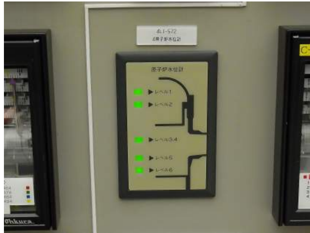
写真9 原子炉水位計（中央制御室）