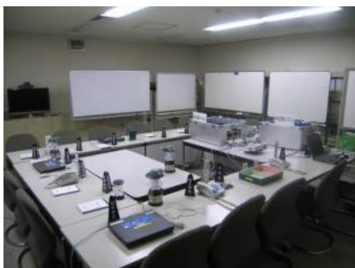
写真 7-1 中央制御室横会議室