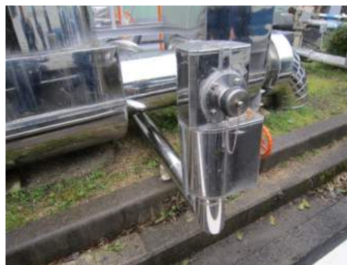
写真 1 1 - 2 タンク出口ホース接続口